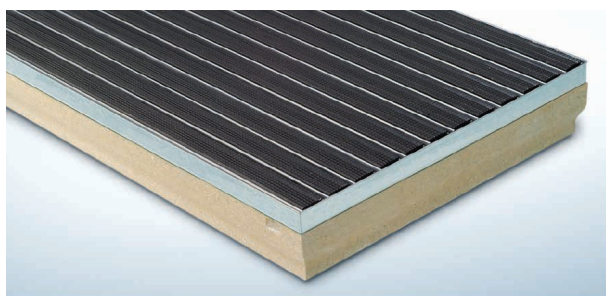
Topwell 22 mm