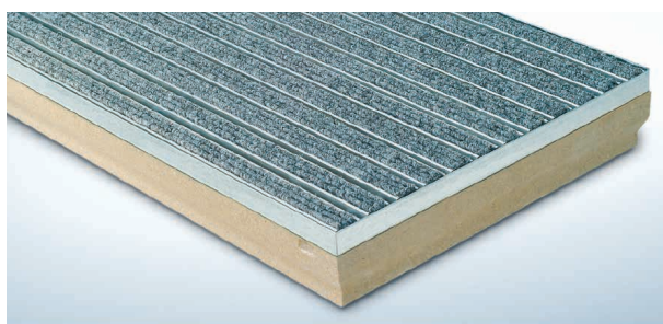
Topwell 22 mm